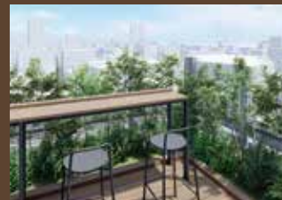
屋上ワークスペース

※ワークブース、屋上庭園及び屋上ワークスペースの家具はイメージで実際のものとは異なります。 ※掲載の完成予想CGおよび平面図は計画段階の図面を基に描き起こしたもので、実際とは多少異なります。 また、形状の細部および設備機器等については省略しております。