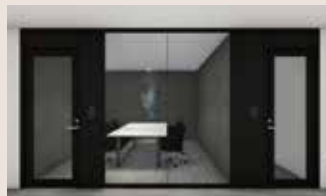
共用会議室/ワークブース

1階に共用会議室とワークブース ® 、テナント専用喫煙所を設置予定。貸室内の面積効率化やWeb会議に対応可能。